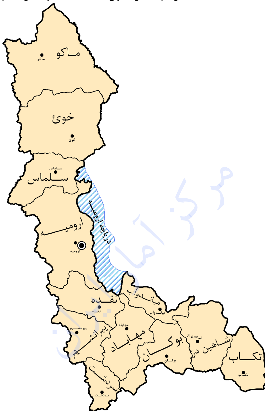
نقشه تقسیمات استان آذربایجان غربی به تفکیک شهرستان سال ۱۳۷۵