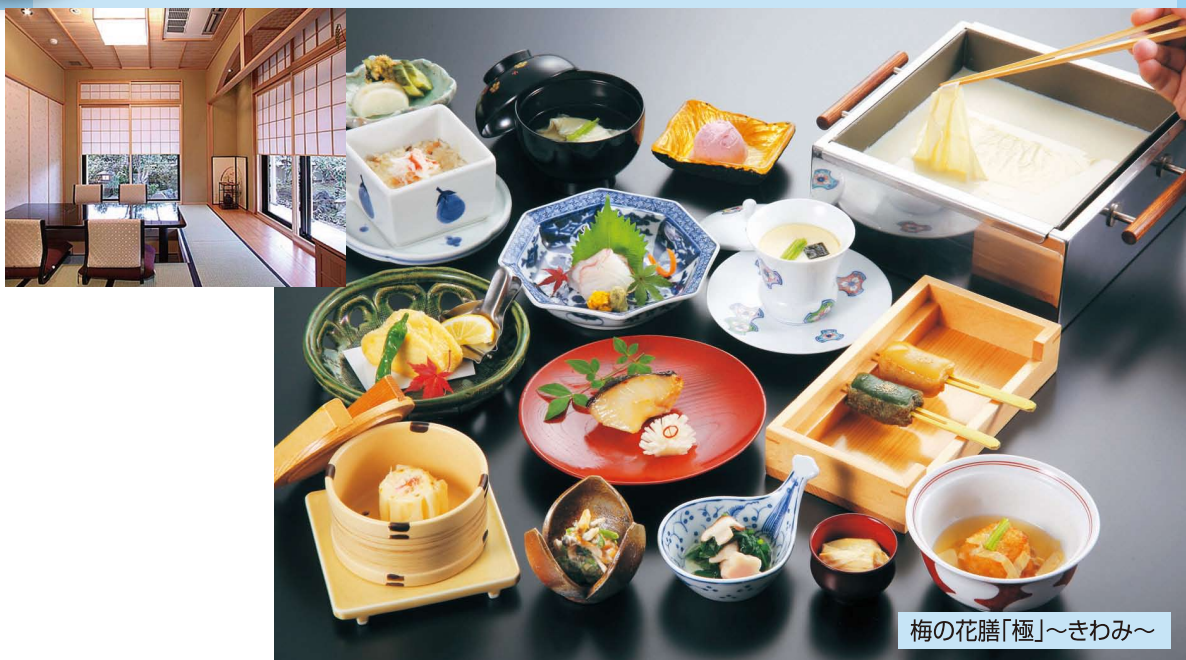
梅の花膳「極」～きわみ～