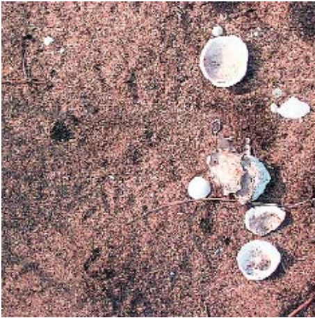
MATERIAL DE SÍTIO ARQUEOLÓGICO NA ÁREA DO AEROPORTO.

arqueológicos cerâmicos, remanescentes da ocupação indígena, no alto da pequena elevação conhecida como Morro Boa Vista e nas proximidades do aeroporto de Goiabeiras. Ainda que Saint-Hilaire não tenha mencionado as frigideiras de moqueca, provavelmente na época de sua passagem já se faziam panelas para cozinhar frutos do mar, pois este é o alimento primordial e preponderante dos nativos da região desde tempos pré-históricos. Segundo informam os estudiosos da culinária e da identidade local, “Os sambaquis, que o proto-capixaba deixou, em diversos pontos do litoral do Espírito Santo, (...) são, em sua essência, um amontoado de conchas partidas e de cascas de moluscos... Esses processos milenares de