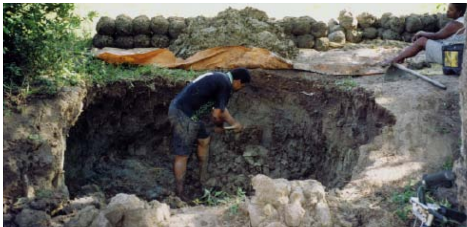
RONALDO CORRÊA EXTRAINDO O BARRO NO VALE DO MULEMBÁ.