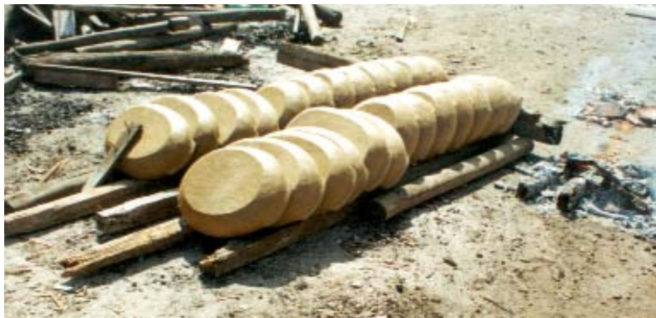
“CAMA” DE PANEIAS A SER COBERTA COM LENHA PARA A QUEIMA.

intervenções nas condições de produção, comercialização e promoção das panelas de barro. Exemplos de iniciativas desse tipo têm sido as do Sebrae, no desenvolvimento de embalagens para as panelas, e as festas anuais das paneleiras, com o apoio das instituições governamentais. O acompanhamento do Iphan tem balizado o apoio e o fomento a ações relacionadas à instrumentalização das paneleiras, assim como à implementação das condições necessárias à sustentabilidade de sua produção.