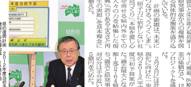
復興計画 2012年度当初予算案を説明する佐藤知事 2月2日

風評被害に立ち向かう 若手農業家たちの挑戦 若手農業家たちは、風評被害に立ち向かうための挑戦を行っている。