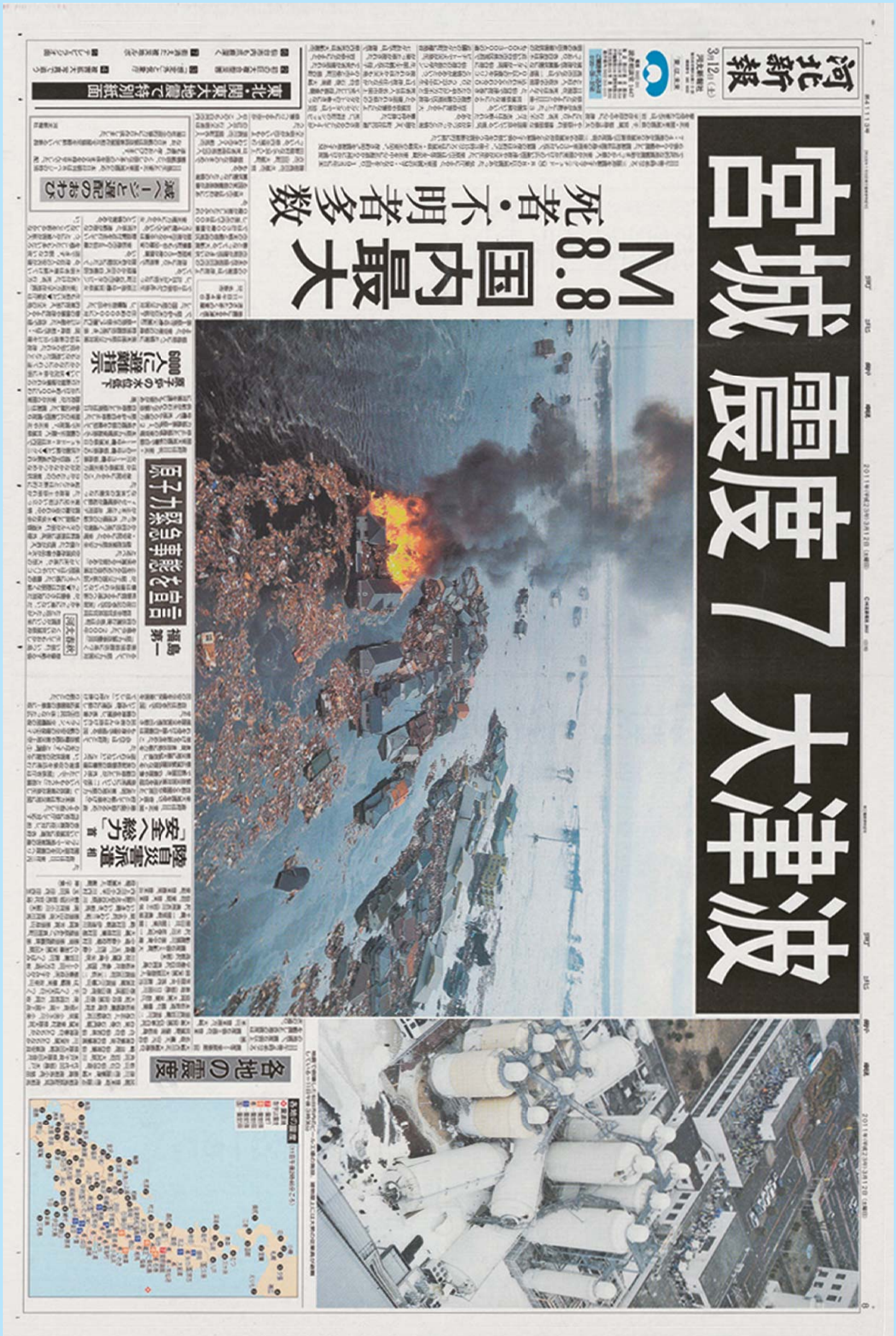
※3月12日朝刊は特別態勢紙面(1面と末面の完全見開き)となりました。

震災はいつかまたどこかで起こるかもしれないから。この紙面は、3県だけでなく、全国の200万人の手に届けられます。忘れることは恐ろしく、忘れられる