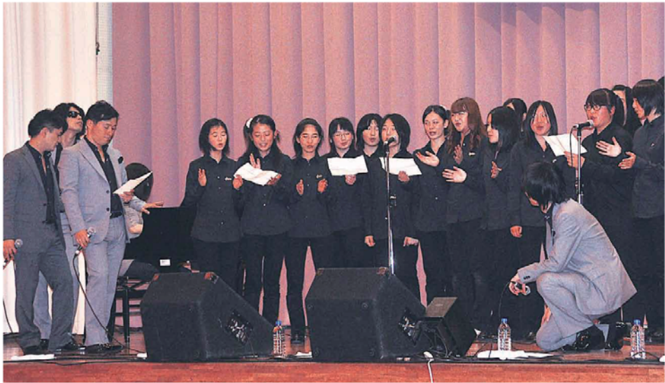
コスプレズと共演を果たしたMJCアンサンブルのメンバー 昨年11月

南相馬市の女子中高生らでつくる合唱団「MJCアンサンブル」は、男性ホスト・カルテット「コスプレズ」や人気女性歌手「Ari(アリエ)」と共演するなど、幅広い活動を行っている。中高生のさわやかな歌声は被災した県民の心を癒している。