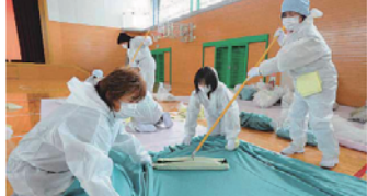
川内村が福村宣言した日、体育館ではカーテンの除染作業が行われていた。=1月31日

本格化へ準備進む 福島県内の除染作業 除染作業は本格化へ準備が進んでいる。除染作業は本格化へ準備が進んでいる。