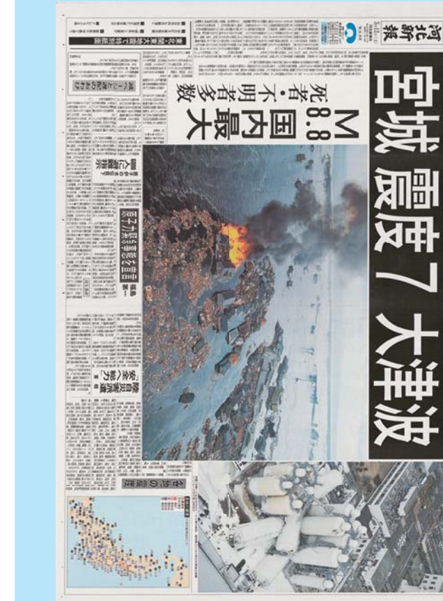
震災はいつかまたどこかで起こるかもしれないから、この紙面は、3県だけでなく、全国の200万人の手に届けられます。忘れることは恐ろしく、忘れられることは悲しい。日常に戻っても、震災を、震災から学んだことを、被災地のことを、忘れないでほしい。この紙面がそのきっかけになることを願っています。