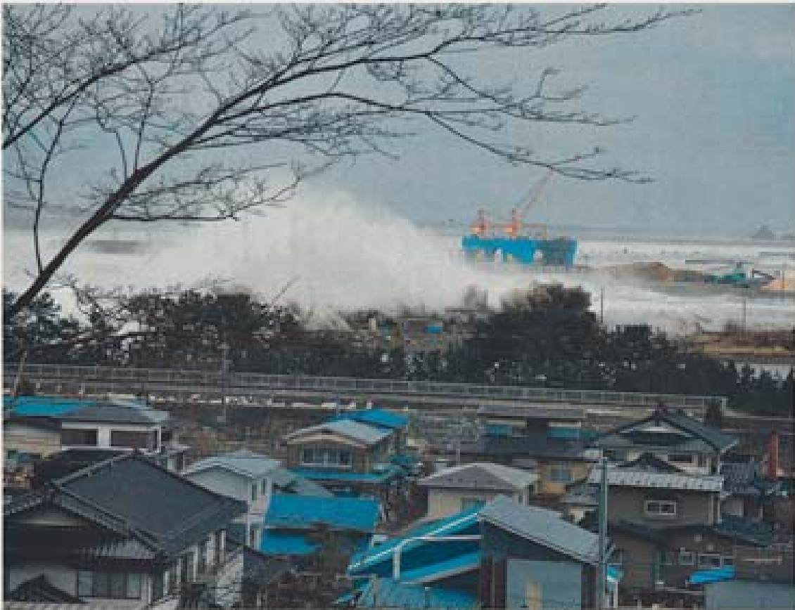
久慈港を襲う大津波＝11日午後3時30分ごろ、久慈市長内町