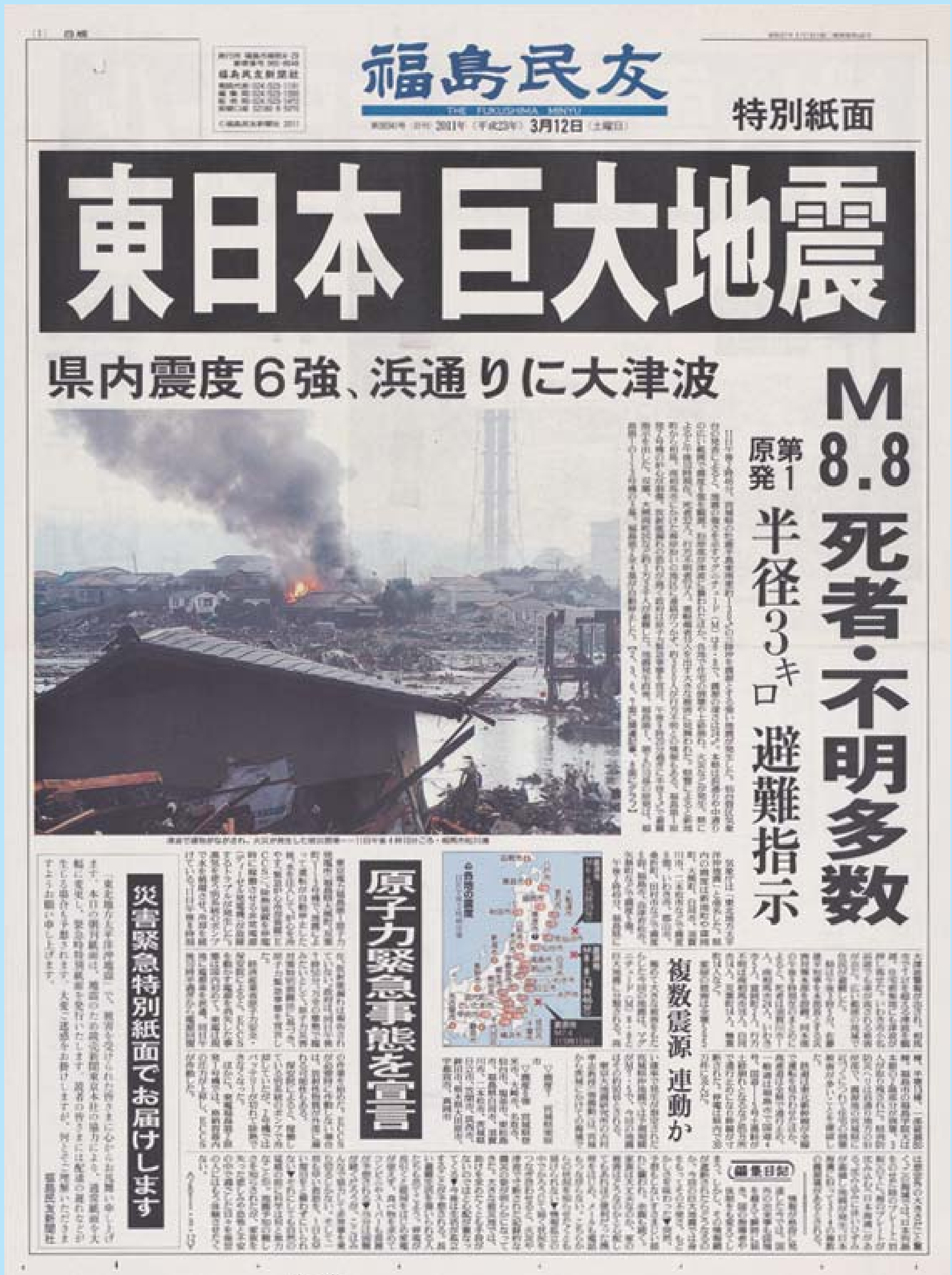
あの日から一年。いまもう一度、岩手、宮城、福島「あの日」を日本中のみなさんに知ってもらうため、私たちは2011年3月12日の紙面を掲載するこ