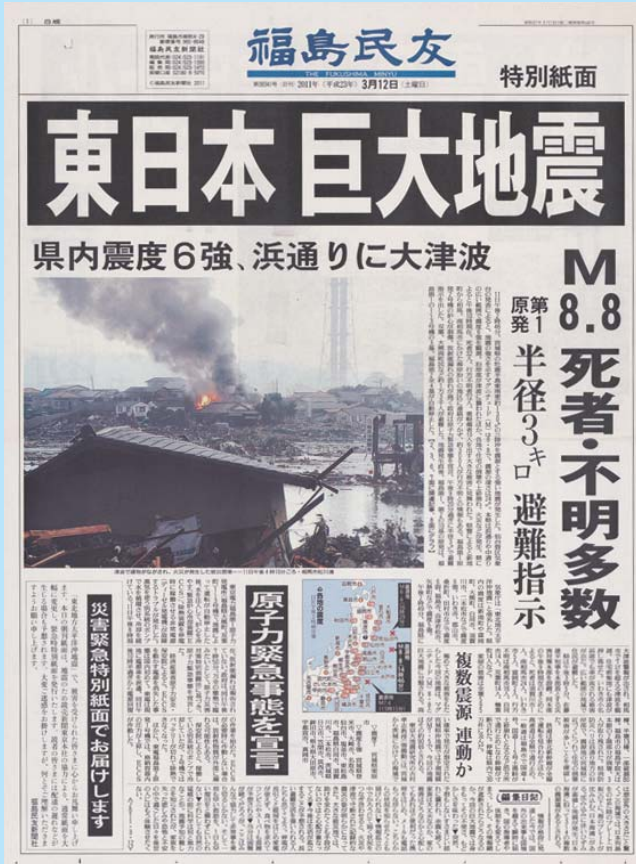
あの日から一年、いまもう一度、岩手、宮城、福島の「あの日」を日本中のみなさんに知ってもらうため、私たちは2011年3月12日の紙面を掲載することになりました。あの日のことは、思い出すのがつらく、苦しい。でも同時に、多くの人に、忘れずに覚えておいてもらわなくてはなりません。なぜなら、