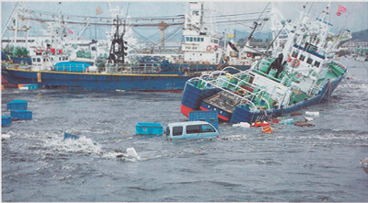
いわき市の小浜漁港に押し寄せた津波に流される漁船と車両—11日午後3時15分ごろ