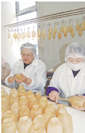
最盛期を迎えた木村商店の「いか徳利」作り。生産を再開した三陸名物は山田町復興のシンボルだ