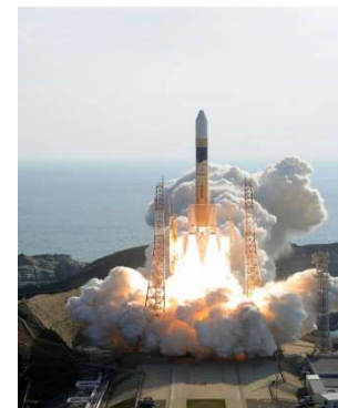
レーダ3号機の打上げ

この打上げ成功により、光学4機、レーダ1機（2012年初めに運用予定）体制となったところ。今後、当面の目標である光学衛星2機、レーダ衛星2機の4機体制を構築するため、着実に開発を進める予定。